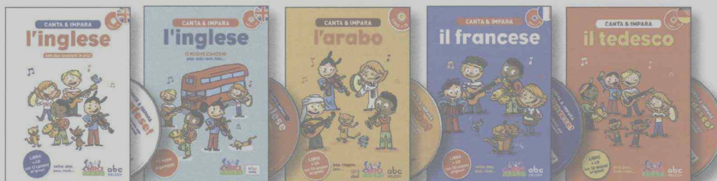
CANTA & IMPARA L'INGLESE EC 11659 (da)