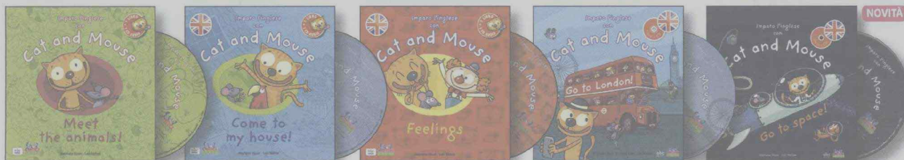
CAT AND MOUSE MEET THE ANIMALS! EC 11763 (dc)