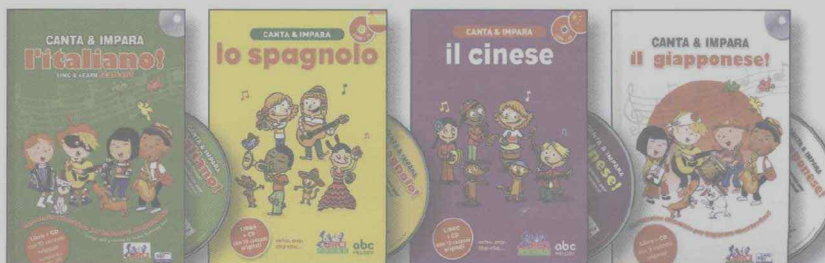
CANTA & IMPARA L'ITALIANO EC 11655 (da)